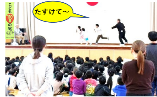
不審者から必死で逃げる子ども達。 こども110番の家の旗がある家に駆け込みます。