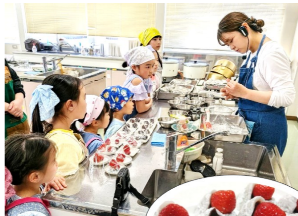
すごく上手にできたね。 美味しそう(へへ)

今回の子ども料理教室は「いちご大福」に挑戦しました。 大福の皮を伸ばしながら形を整えるのが難しかったようですが、子ども達が一生懸命取り組み姿はかっこよく、頼もしく感じられました。 いちご大福の他にもミニトマトやマスカット等、旬の果物を使用したアレンジレシピが可能なので、参加者の方から自宅でも作ってみたいとのご意見もいただきました。 今回は子どもだけの一人参加もOKとしていましたが、親子で一緒に参加したいという要望もあり、それぞれ楽しい時間を過ごすことができました。