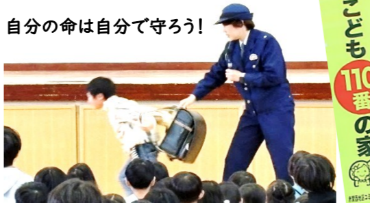
自分の命は自分で守ろう!

教頭先生からは「皆さんが安全に学校に来られたり、帰れるのは地域の方々のおかげです。自分で安全に過ごすためにはしっかり確認して歩くことです。」とお話がありました。また、協力頂いた宗像警察署の方からは「怖いことに遭ったら、とにかく逃げる、大きな声を出す、助けを求める、110番の家に駆け込むことが大事です。」と不審者に対する心構えを教えてください、皆さんで確認しました。 自分の通学路のどこに「こども110番の家」の旗があるのを見ておくことも忘れないうでください。