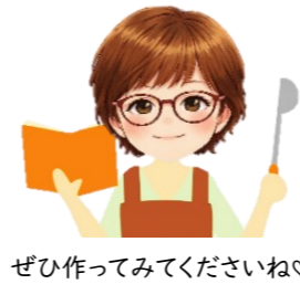
ぜひ作ってみてくださいね♡